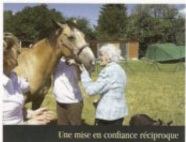
Une mise en confiance réciproque