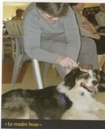
« Le rendre beau »