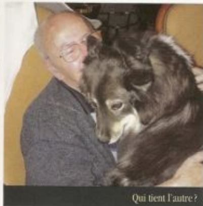
Qui tient l'autre ?

Bien souvent, les personnes combinent ces différentes actions : elles veulent passer un moment d'intimité avec l'animal car « lui au moins il ne juge pas » et « les secrets glissés dans l'oreille ne sont jamais répétés » !