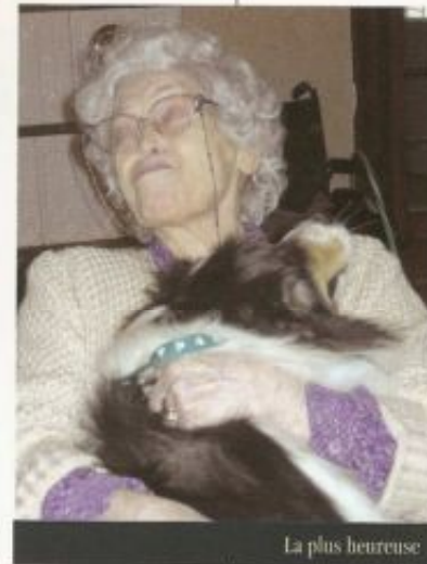
La plus heureuse

La zoothérapie ne guérit pas une personne de sa maladie ou de la vieillesse ; elle vient compléter des méthodes dites traditionnelles à la demande du médecin. Car l'animal « renforce la thérapie mise en place » (IFZ) ➔