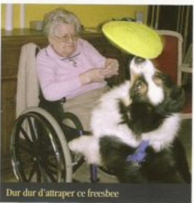
Dur dur d'attraper ce freesbee

Bien souvent, les personnes combinent ces différentes actions : elles veulent passer un moment d'intimité avec l'animal car « lui au moins il ne juge pas » et « les secrets glissés dans l'oreille ne sont jamais répétés » !