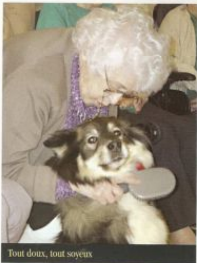
Tout doux, tout soyeux