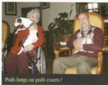
Poils longs ou poils courts ?

Selon les sites, les demandes et les désirs des personnes âgées, je viens soit avec les chiens, soit avec les chiens et les lapins car, suivant les participants, il y a ceux qui préfèrent les poils courts, les poils soyeux ou les poils longs... C'est déjà toute une approche que de définir ces références tactiles ou de retrouver un vocabulaire imagé !