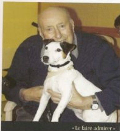
« Le faire admirer »