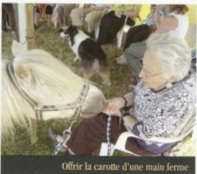
Offrir la carotte d'une main ferme

► Se souvenir du nom de l'animal, de ses habitudes, de son âge, de sa race... Cette dernière demande conduit souvent les personnes à s'exprimer sur l'animal qu'elles ont possédé ou connu.