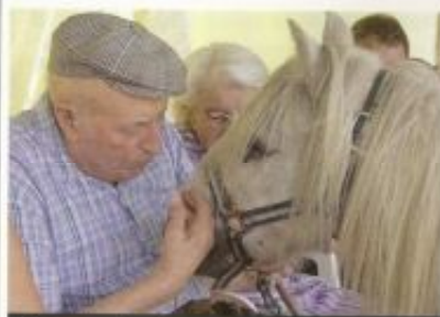
Retrouver d'anciens gestes