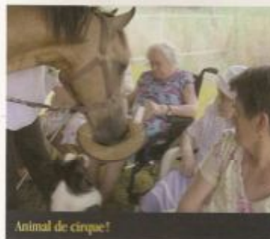
Animal de cirque !

► Donner des ordres ou une succession d'ordres (par exemple demander à Boston le chien de faire la galipette)