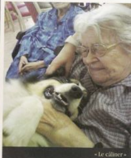
« Le câliner »